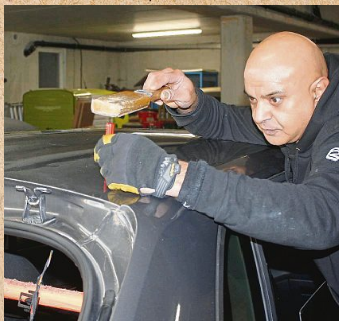
Hagelschäden werden professionell ausgebessert.