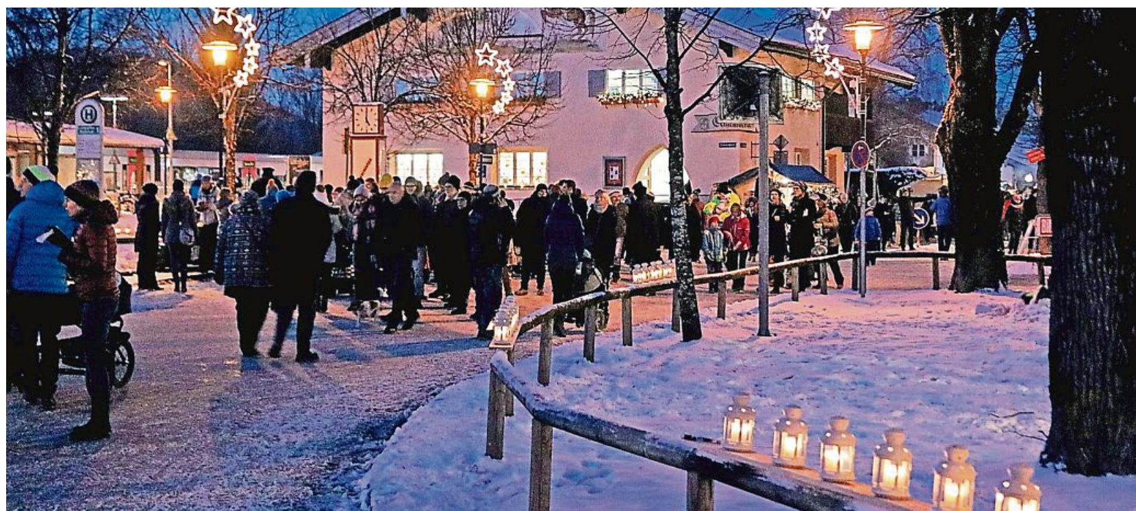
Beim Christkindlmarkt leuchten viele Lichter in den Straßen des Ortskerns von Lenggries.

Im Jahr 1985 hat die UN beschlossen, jedes Jahr eine Internationalen Tag des Ehrenamts zu begehen. Seit 1986 wird am 5. Dezember dieser Gedenk- und Aktionstag zur Anerkennung und Förderung ehrenamtlichen Engagements begangen. Egal ob im religiös/kirchlichen, kommunalen oder öffentlichen Bereich, in Musik und Kultur, in der Entwicklungszusammenarbeit, dem Katastrophenschutz oder der Feuerwehr, in den Schulen, Kindertagesstätten, der Tafel, im sozialen Bereich, im Umwelt- und Naturschutz, in den unzähligen Sportarten und in all den vielen anderen Bereichen, unser Zusammenleben würde oftmals nicht funktionieren und wäre um vieles ärmer. Anlässlich dieses Tages bedankt sich die Gemeinde Lenggries bei allen ehrenamtlich Tätigen für ihren unersetzlichen Dienst am Nächsten und unserer Gesellschaft.