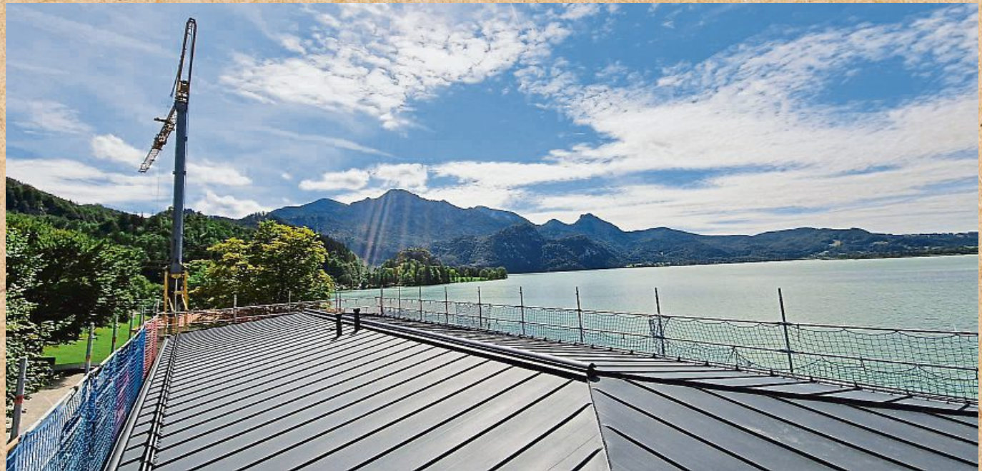
Hoch überm See: Eine Großbaustelle der Firma Reiser.