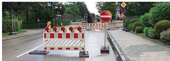
Absperrungen müssen rechtzeitig beantragt werden.

LN. Das Ordnungsamt der Gemeinde Lenggries möchte darauf hinweisen, dass zur Durchführung von Arbeiten im öffentlichen Straßenraum eine verkehrsrechtliche Anordnung erforderlich ist. Die Anordnung regelt unter anderem, wie die Arbeitsstelle abzusichern und zu kenn-