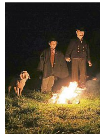
Die beiden Hirten wärmen sich am Lagerfeuer.

werden bei der Aufführung in der Lenggrieser Pfarrkirche auf einer Großleinwand