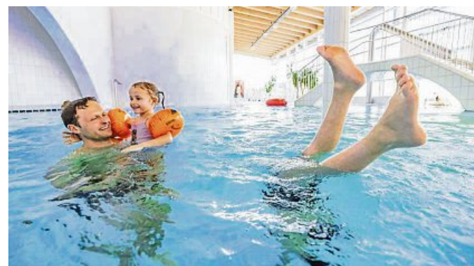
Abtauchen in der Lenggrieser „Isarwelle“.

Wie wäre es mit einer „Lenggrieser Kart'n“ als Weihnachtsgeschenk? Rechtzeitig zum Lenggrieser Christkindlmarkt am Samstag, 9. Dezember, ist die Lenggrieser Kart'n für 2024 da. Mit mittlerweile 45 Anbietern ist die Karte im kommenden Jahr besonders attraktiv, um Geld zu sparen. Erwerben können Sie die Kart'n erstmals beim „Lichterzauber im Advent“ im Pavillon der Werbegemeinschaft an der Schützenstraße. Alle Rabatte mit vielen neuen Vergünstigungen finden sich auf www.werbegemeinschaft-lenggries.com .