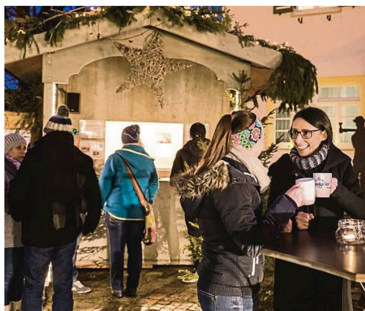
Prost vorm Glühweinstandl am Rathausplatz.