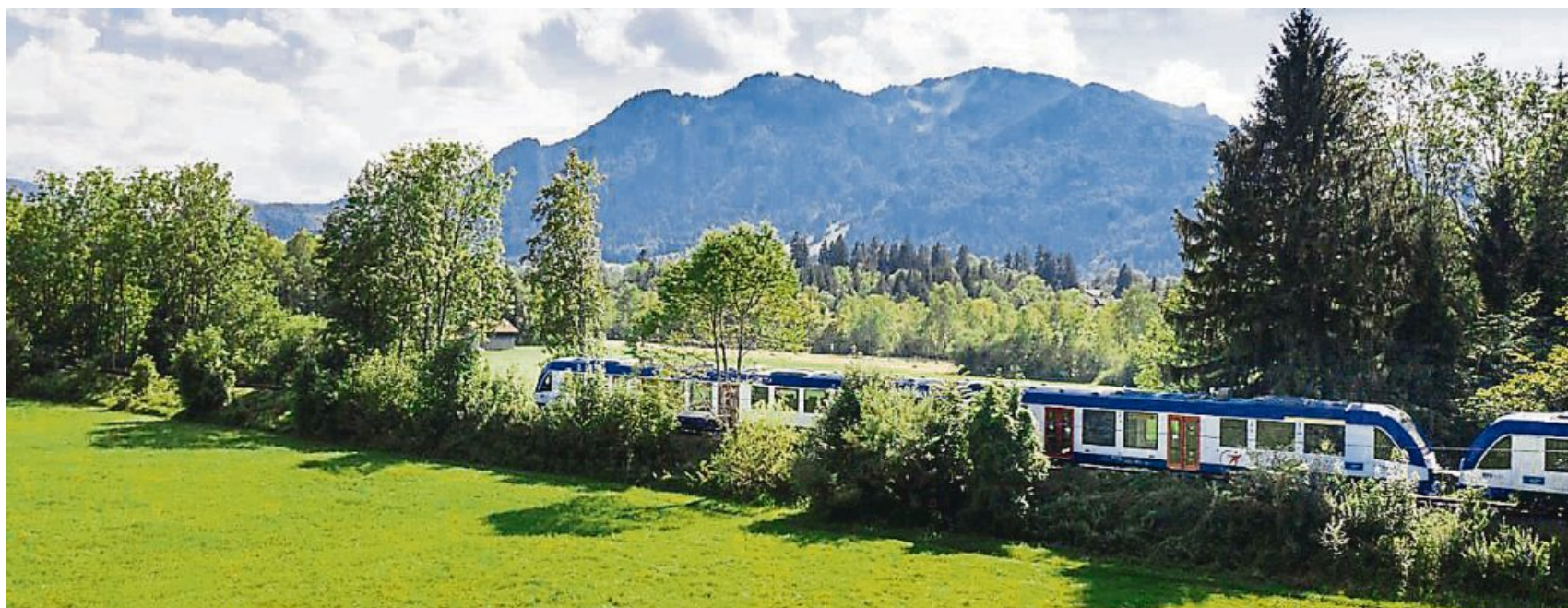
Mit der Bayerischen Regiobahn nach Lenggries: Die Vergrößerung des MVV-Tarifgebiets sorgt für günstigere Tickets.

Es ist jedoch zu beachten, dass für Reisen über diese Zonen hinaus ein separates Ti-