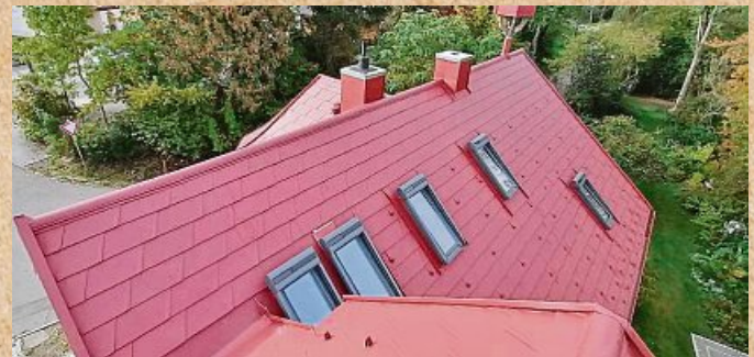
Steildächer sind eine Herausforderung für Handwerker.