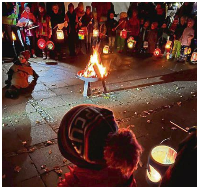
Stimmungsvolle Martinsfeier mit Feuerschale und Lampions.

Zum Abschluss nun ein kleiner Ausblick in den Dezember: Am 21. Dezember um 17 Uhr beteiligt sich die Wegscheider Kita am „Lenggrieser Adventsfenster“. Kommt vorbei und lasst euch überraschen. Wir freuen uns auf Euch und wünschen eine besinnliche Adventszeit.