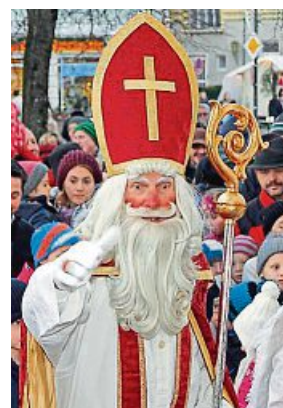
Der Nikolaus beschenkt die kleinen Besucher.

Um 16 Uhr kommt der Nikolaus und verteilt mit seinen Engeln Geschenkpackerl am Rathausplatz. In der Bücherei findet um 17 Uhr ein Kasperltheater statt. Der Kindergarten St. Jakobus an der Marktstraße verkauft von Kinderhand gebastelten Christbaumschmuck. Beim Waldkindergarten Auenland und beim Café Brauneck können die Kinder Stockbrot an einer riesigen Feuerschale rösten. Der Kindergarten St. Josef hat sich dieses Jahr etwas Beson-