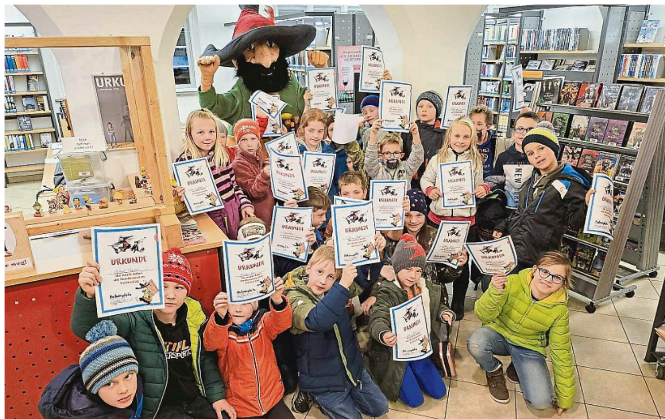
Der Räuber Hotzenplotz beim Vorlesetag inmitten der Kinder in der Lenggrieser Gemeindebücherei.

Hotzenplotz besucht das Lenggrieser Bilderbuchkino