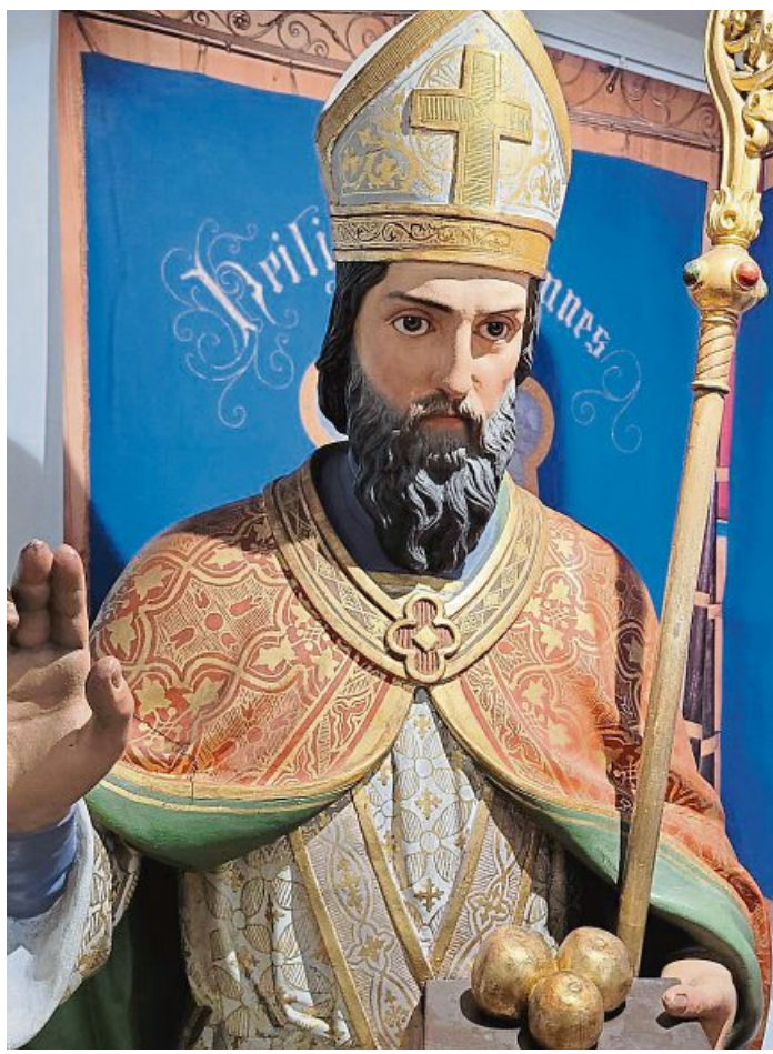
Eine Nikolaus-Figur mit drei goldenen Äpfeln.

Der Heilige stammte ursprünglich aus Patrrara (Kalkan), eine antike Stadt in Lykien an der Mittelmeerküste, die damals zum oströmischen Reich gehörte. Bekannt wurde er aber in seinem späteren Wirkungskreis in Myra, dem heutigen Demre, ebenfalls in Lykien. Da Nikolaus von Myra einer der wichtigsten Heiligen der Ostkirchen war und ist, hat sich Myra beziehungsweise Demre, zu einem der bekanntesten Wallfahrtsorte der Christen entwickelt. In der ersten Hälfte des 4. Jahrhunderts bis zu seinem Tod wirkte er in und um Myra, das ein eigener Bischofssitz war. 325 soll er am Konzil von Nikäa teilgenommen haben. Später wur-