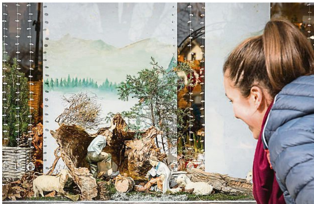
Alte Krippen sind in den Schaufenstern der Lenggrieser Geschäfte zu sehen.

Der Höhepunkt des „Kripplerwegs“, der pünktlich zum ersten Adventssonntag begann, wird wieder in der Pfarrkirche St. Jakob zu bestaunen sein. Hier können Besucher eine aufwändige orientalische Krippe mit zahlreichen Details bewundern. Für die Aussteller soll es auch wieder eine kleine Anerkennung geben: es werden die drei schönsten Krippen gekürt. Jeder Besucher kann bis zum Sonntag, 10. Dezember, seine Stimme abgeben.