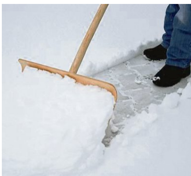
Gehwege müssen werktags ab 7.30 Uhr geräumt und bei Bedarf gestreut werden.

LN. Aufgrund des jetzt begonnenen Winters möchte die Gemeinde Lenggries ihre Bürger an die Räum- und Streupflicht erinnern. Die Anlieger an Straßen und Gehwegen sind hiernach verpflichtet, täglich zu prüfen, ob Winterdienstarbeiten notwendig sind. Gehwege und Gehbahnen müssen ab 7.30 Uhr geräumt und bei Bedarf mit abstumpfenden Materialien, wie zum Beispiel Sand oder Split, gestreut sein. Das Streuen von Tausalz ist nur bei besonderer Glättegefahr (zum Beispiel an Treppen oder steilen Steigungen) zulässig. Diese Sicherungsmaßnahmen sind bis 20 Uhr so oft zu wiederholen, wie es zur Verhütung von Gefahren für Leben, Gesundheit, Eigentum oder Besitz von Menschen erforderlich ist. Besonders wichtig ist das rechtzeitige Räumen und Streuen auf den Schul- und Arbeitswegen. An Sonn- und Feiertagen beginnt die Räum- und Streupflicht erst gegen 8 Uhr, da der Verkehr