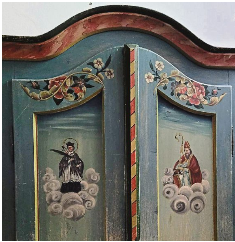
Auf den Türen eines Flößer-Schranks: Die heiligen Nepomuk und Nilolaus.

Hier haben wir die Gabenausschüttung und den Hinweis drauf, dass er ein Patron der Schiffsleute war und ist. Und daher, um den Bogen nach Lenggries zu schlagen, wo heute noch ein besonderer Augenmerk auf der Verehrung des Heiligen liegt. Denn Nikolaus ist nicht nur der Patron der Seeleute und Schiffer, sondern er ist dementsprechend auch prädestiniert als Heiliger und Schutzpatron der Isarflößer. Seine Verehrung zusammen mit der Verehrung des heiligen Nepomuk sind im Isarwinkel untrennbar verbunden. Selbst im häuslichen Bereich wird die Popularität beider Heiliger an der Bemalung der „Lenggrieser Flößer-Schränke“ sichtbar.