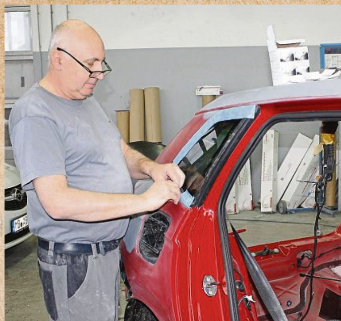
Die Lackiererei setzt umweltfreundliche Farben ein.