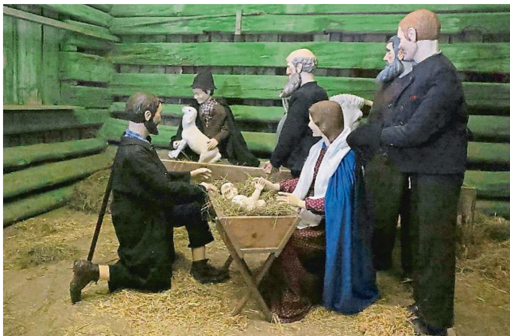
Die Geburt Christi: Für das Krippenspiel wurden die Figuren in einem alten Stadel am sogenannten Stie-Anger im Längental bei Arzbach aufgebaut.

Nach dem Schnitzen ging es an die Herbergssuche und an die Wanderung von Maria und Josef – aus der Stadt hinaus aufs Land. Dazu wurden die Figuren mit Transportfahrzeugen unter anderem nach Wolfratshausen, auf den Reutberg, den Tölzer Kal-