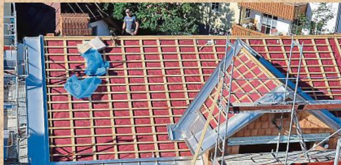
Über den Dächern ist der Arbeitsplatz der Spenglerei.