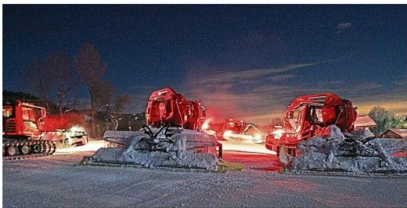
Eine Pistenraupenshow gibt es beim Ski-Opening am 13. Dezember.

Bergstation der Brauneck-Bergbahn Bilder in HD-Qualität an das Bayerische Fernsehen, den Privatsender München TV und ins Internet. Mit diesem Service können sich Gäste live und in Echtzeit über die aktuellen Gegeben-