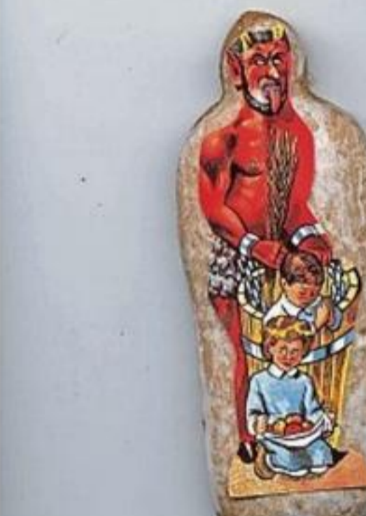
Kochbuch und Klaubauf: Der Speisezettel für Weihnachten im dem Buch aus dem Jahr 1854, darunter eine Klaubauf-FDarlstellung auf einem Lebkuchen.

auch eine Variante mit dem Klaubauf (oder auch Krampus genannt). Für ihn war kennzeichnend, dass er entgegen dem hl. Nikolaus mit struppigem Fell zum Teil sehr spärlich bekleidet war und vor allen Dingen Hörner auf dem Kopf trug. Dieser Geselle übernahm den erzieherischen Part und drohte mit rasselnden Ketten den unfolgsamen Kindern. Dass er damals wohl im Zeitalter vor dem Internet Erfolg damit hatte, zeigen die Darstellungen, wie hier auf dem Lebkuchen, auf dem er ein Kind in eine Butte steckt.