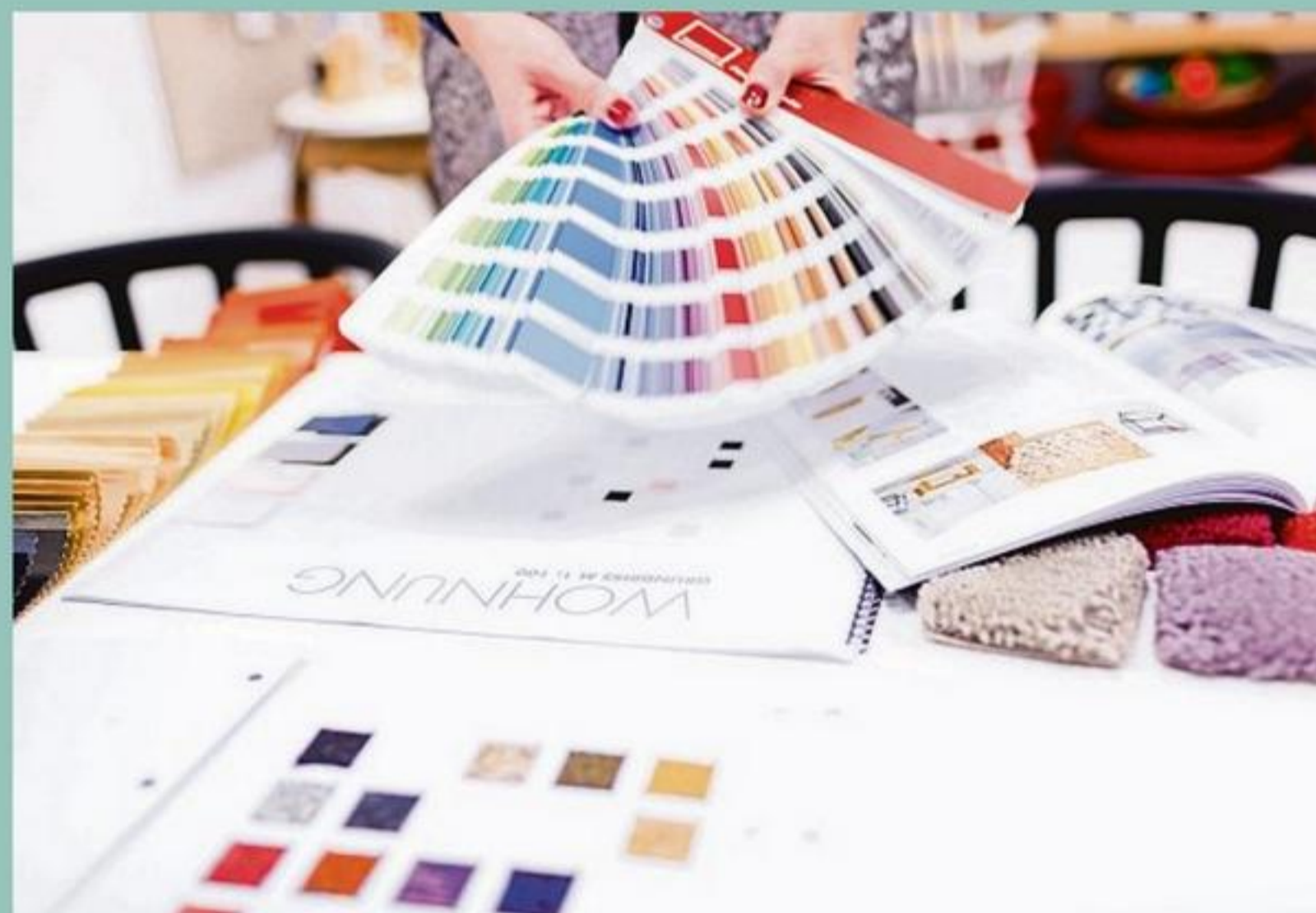
Innenarchitekten helfen mit Tipps zum Beispiel zum richtigen Farbkonzept.

Die vielleicht einfachste Variante dieser individuellen Gestaltung kennt jeder aus dem Baumarkt. Was vor Jahren noch Malerfachgeschäften vorbehalten war, hat Schule gemacht: Wer seine Lieblingsfarbe nicht