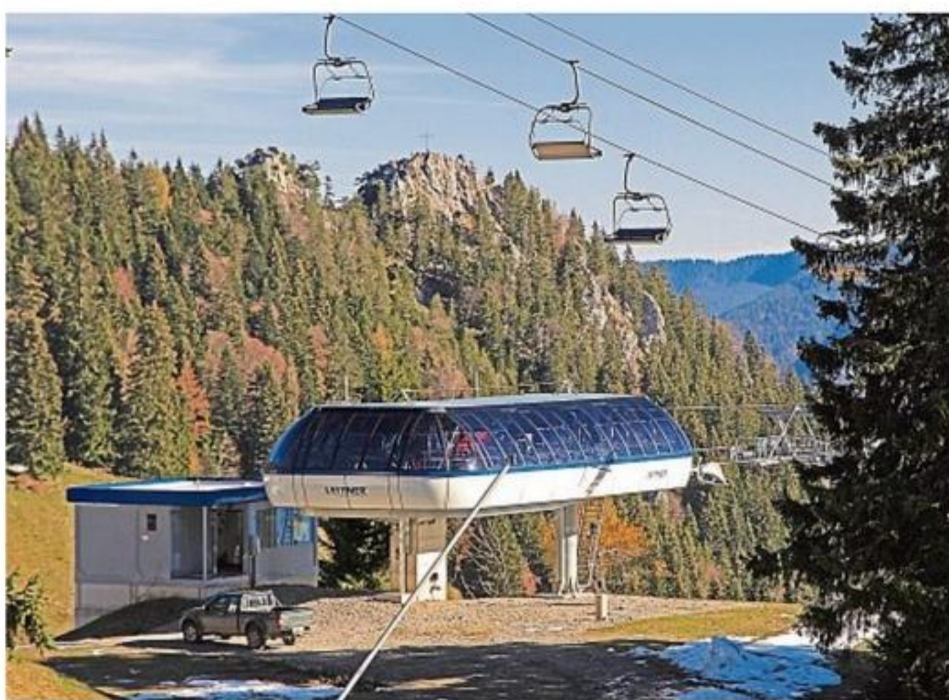
Startklar: Der neue Sechser-Sessellift, hier die Bergstation des „Milchhäuslexpress“.

Als eine von drei neuen Panoramakameras im Tölzer Land liefert die neue Kamera des Anbieters Feratel an der