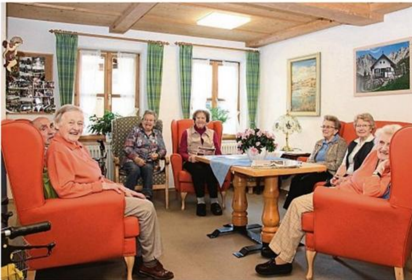
Die neue Sitzzecke ist ein gemütlicher Mittelpunkt im Lenggrieser Haus der Senioren.

Das Haus der Senioren ist ein betreutes Wohnen für rüstige und selbstständige Senioren. Es ist weder ein Altenheim noch eine Pflegeeinrichtung im Sinne des Heimgesetzes. Wer also seinen wohlverdienten Ruhestand in Ruhe genießen möchte, ist im Haus der Senioren genau richtig. Der Tagesablauf kann von jedem Bewohner vollkommen frei gestaltet werden. Die Mitarbeiter des Hau-