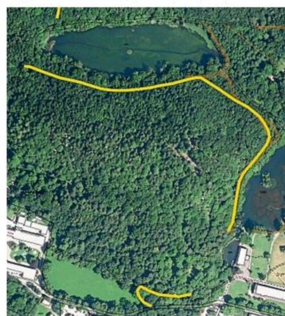
Forstarbeiten am Hohenburger Weiher: Die gelb hinterlegte Linie stellt den Trassenverlauf des neuen Schlepperweges dar.

Die geplante Dauer des Bauvorhabens wird auf drei Wochen festgelegt. Es werden jedoch Bauabschnitte definiert um eine Beeinträchtigung der Naherholungssuchenden soweit wie möglich zu vermeiden. In diesen Bauabschnitten wird zeitgleich mit zwei Baggern gearbeitet. Die Bagger treffen sich jeweils in der Mitte des Bauabschnitts. Zeitgleich wird in den Bauabschnitten Holzernete betrieben, um die zeitliche Dauer der Sperrung zu vermindern.