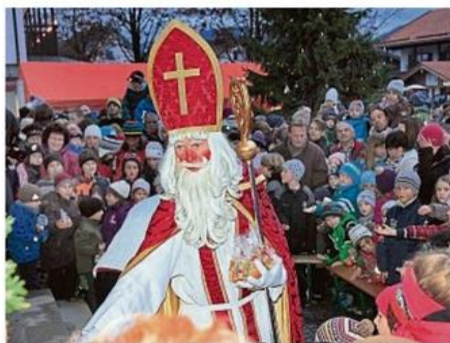
Mitten unter den Kindern: Der Nikolaus verteilt Geschenke an die kleinen Christkindlmarkt-Besucher.