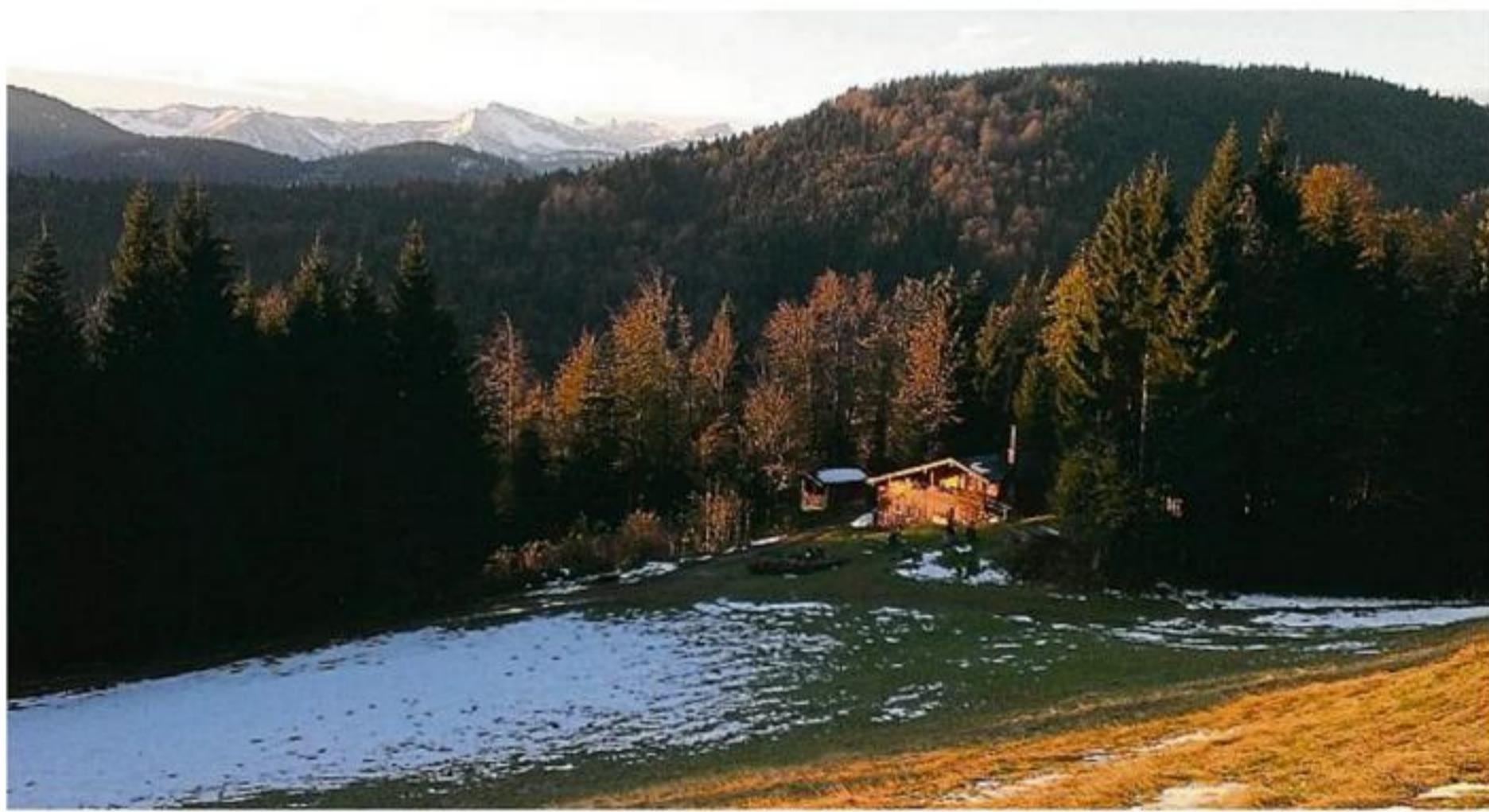
In der Spätherbst-Sonne: Die Eselau-Alm im Brauneckgebiet war das Ziel eine Jugendbegegnung.

LN. Nicht nur Alt und Jung haben im Jugendtreff in den letzten Wochen zueinander gefunden – wie beim Tag der offenen Tür (siehe untenstehenden Artikel), auch die erfahrenen älteren Jugendlichen stellen ehrenamtlich Arbeitskraft und Erfahrung zur Verfügung bei der „Öffnung ohne Leitung“, bei der Begleitung des dreitägigen Hüttenausflugs oder am Verkaufstand beim Lenggrieser Lichterzauber, bei dem der Lenggrieser Jugendtreff mittlerweile schon fast traditionell mit einem Stand vertreten ist.