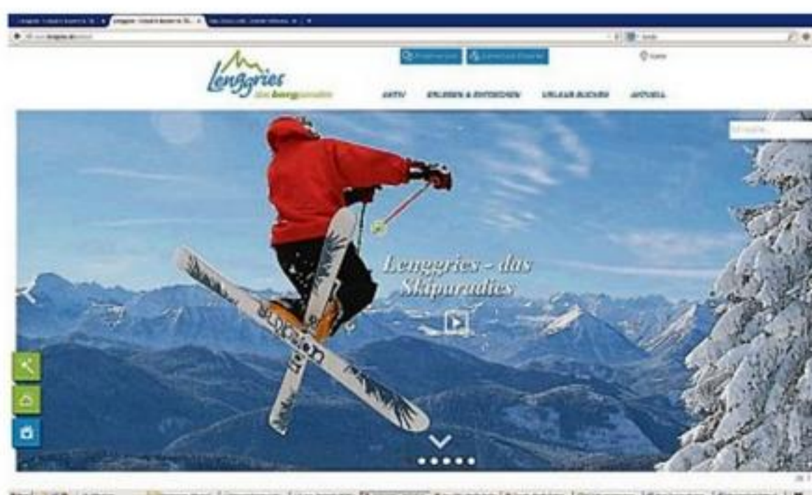
Als Skiparadies wirbt Lenggries auf seinen Winter-Tourismuseiten.

Der Auftritt soll neue Besucher ansprechen und als Urlaubsgäste gewinnen, die so gleich per Internet nach der passenden Unterkunft suchen können. Auch die Darstellung der Gastgeber wurde von der Firma Feratel neu angepasst, um den Besucher noch leichter zu seiner Wunschunterkunft zu leiten. Die Fremdsprachenversionen, der Bürgerservice sowie die Seiten Handel und Gewerbe werden 2015 umgesetzt.