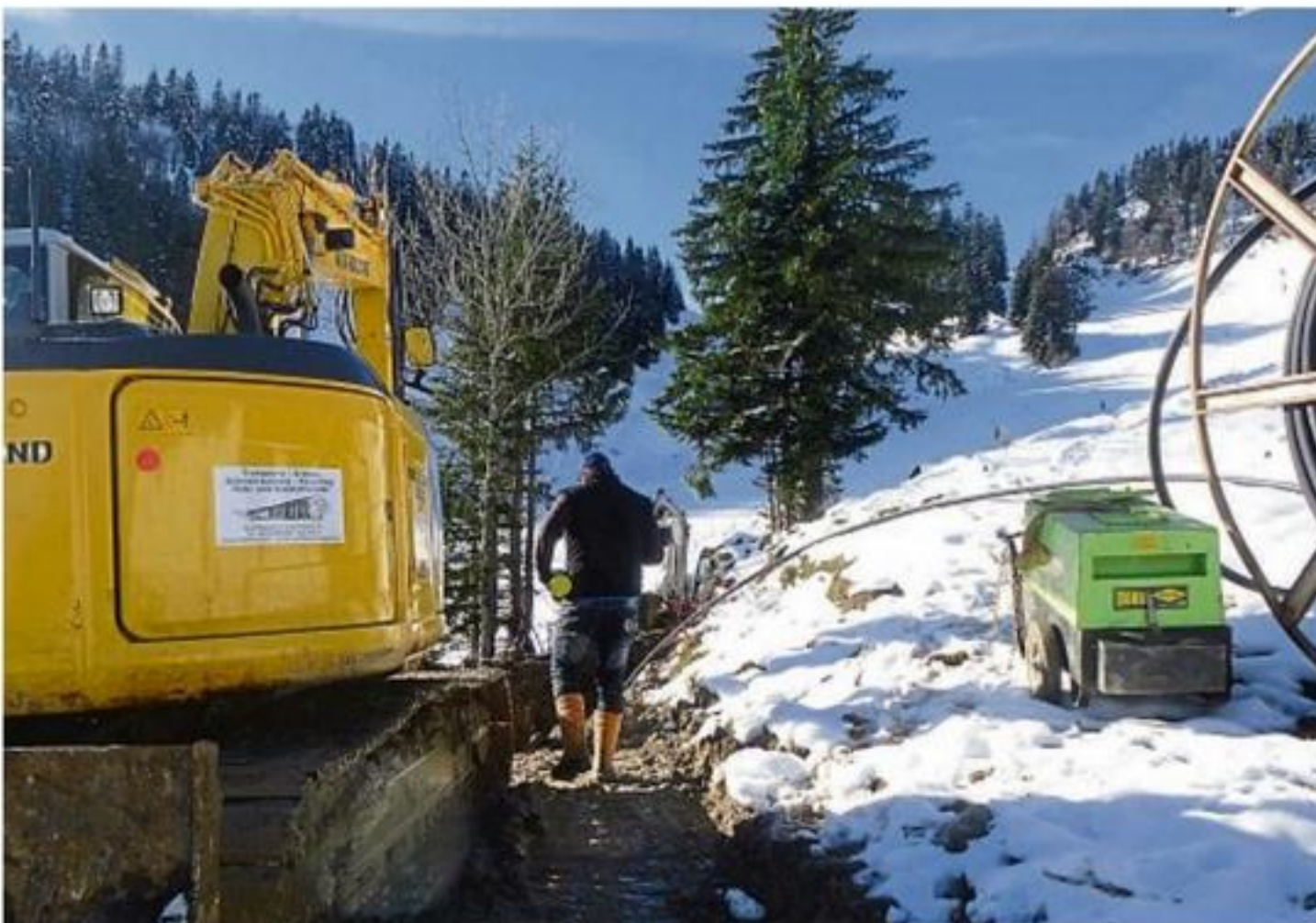
Letzte Arbeiten vor dem Wintereinbruch: Die Baumaßnahme am Brauneck ist eingestellt.

Die Leitungen sind nun bis auf einige fehlende Zusammenschlüsse verlegt. Die 23 Hütten, die an den Abwasserkanal angeschlossen werden, konnten bereits mit der Kanaltasse erreicht werden. Im Frühjahr 2015 rücken die Firmen mit ihren Leuten und Maschinen wieder an, um das Projekt fertig zu stellen. Die Inbetriebnahme der Leitungen ist für Ende 2015 geplant.