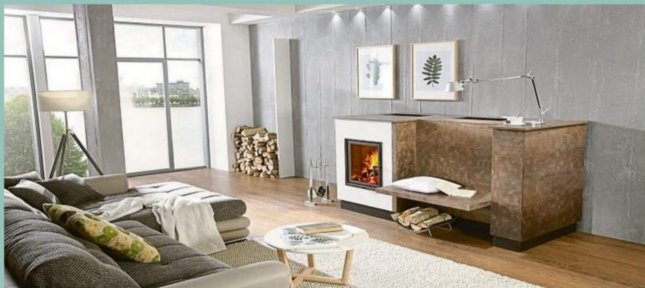
Mit dem Kamin- und Kachelofen entfliehen viele Immobilienbesitzer der Heizkostenspirale.

Haus- und Heizungs-Modernisierung mit Kachelofen & Co: